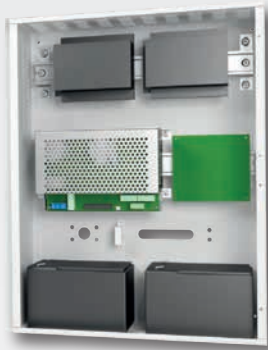
Enhet med 12Ah batterier

*Enheter med batteri har inget E-nr bara modellbeteckning