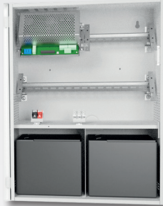
Enhet med 40Ah batterier